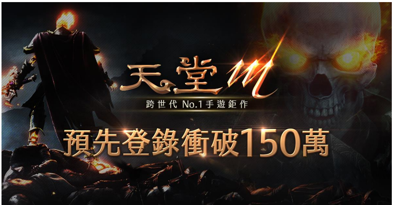
《天堂 M》中文版官網預先登錄再創佳績，截至 10 月 31 日止突破 150 萬大關

【橘子新聞】遊戲橘子代理韓國遊戲霸主 NCSoft 開發的跨世代 NO.1 手遊鉅作《天堂 M》，繼預先登錄首日破 54 萬，一周破 80 萬後再創捷報，10 月 26 日中午官方網站搶先開放「預先創角」活動後，再掀一波熱潮，截至 10 月 31 日止，登錄人數突破 150 萬大關，再現玩家們對《天堂 M》的期待！