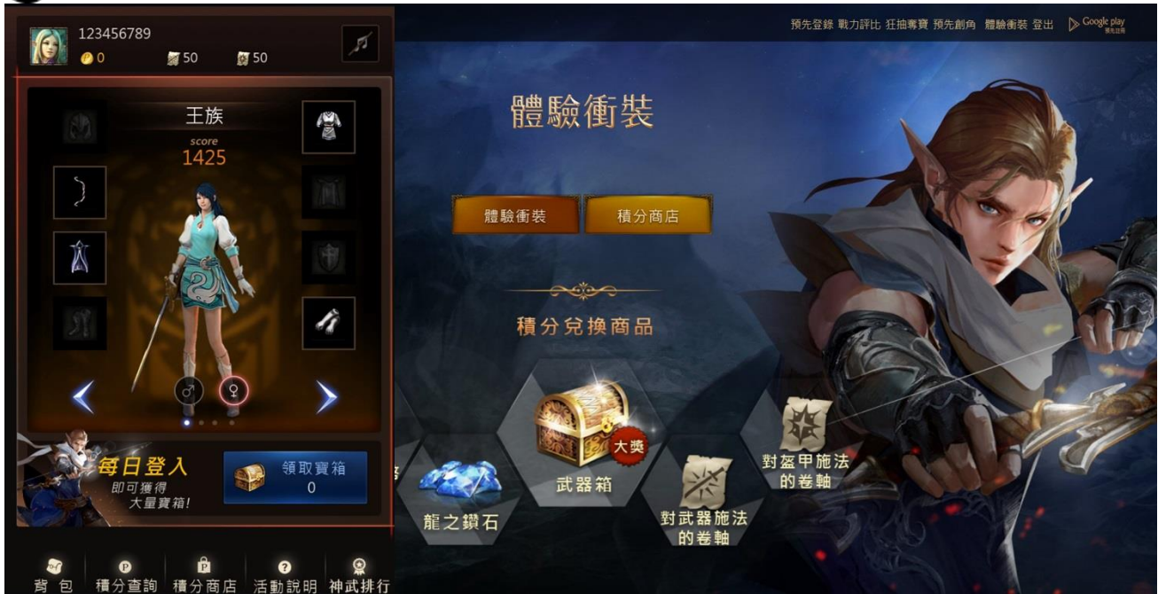
為讓玩家搶先體驗裝備強化遊戲內容，《天堂 M》官網同步釋出「體驗衝裝」活動